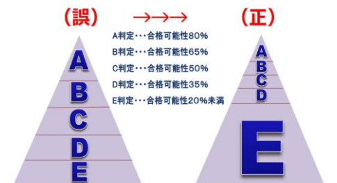
模試の判定別人数のイメージ図