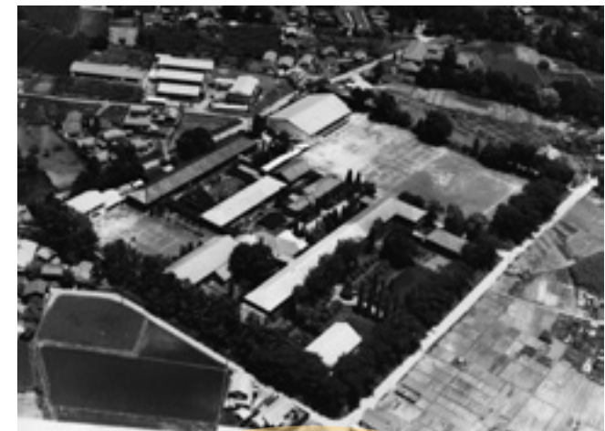
現在 弥生ヶ丘の今昔