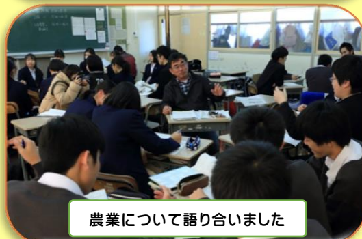
農業について語り合いました