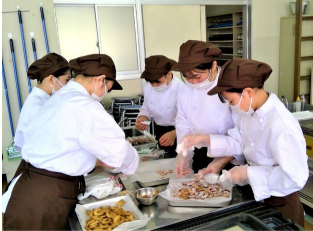
2年フードデザインコース 焼き菓子販売 仕上げ チームに分かれて焼き菓子を製作。袋詰めをして 先生や県の方に届けました。イキイキ取り組む姿に 先生も合格点！