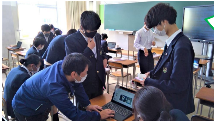
1年 コミュニケーション英語 グループでプレゼン資料を作成！ 韓国、日本の食文化などなど H先生はアニメのグループをサポート中！ 早く進んだグループは各自、AI教材「すらら」で学習