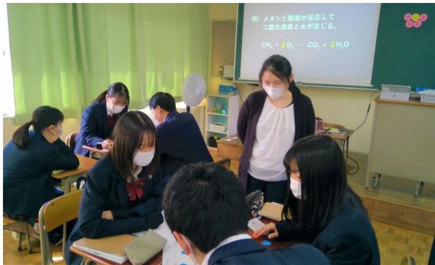
3年 化学基礎 色紙元素を使い、 話し合って理解しよう！ あたたかく見守るF先生