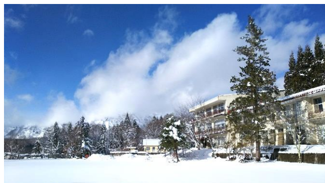
冬晴れの戸隠分校