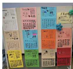
JRC クラブ (カレンダー・バルーンアート)

どの部活も、日頃の活動の成果を充分に発揮したとても良い発表会となりました。今後も意欲的に活動に取り組んでいきます。