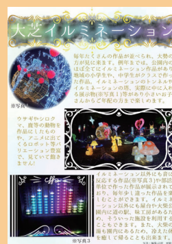
3-2 古村更紗 「大芝イルミネーション」