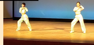
長野県ダンフェスティバル スモールの部 優勝!