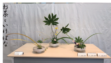
茶華道部(お茶といけばな)