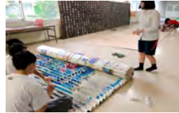
全校制作のモザイクアートと制作風景