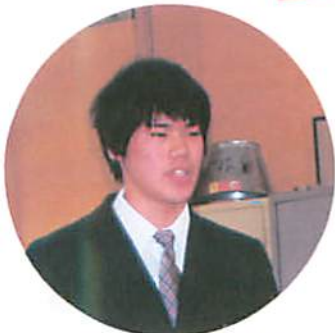
辰野高校生徒会 を代表して挨拶