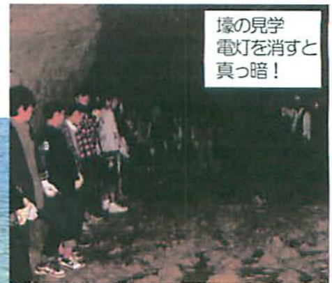
壕の見学 電灯を消すと 真っ暗！

のカーサムーチーという月桃（げつとうショウガの仲間）で沖縄から九州南部に分布の葉で包んだお餅を作りました。月桃の葉はよい香りがして、アロマオイルにも使われると聞きました。この他にサターアングーという沖縄風ドーナツも作りました。この実習では地元の人たちと交流ができ、とても楽しい思い出が作れました。 沖縄は、今、普天間基地の移設問題にゆれています。修学旅行では基地を見ることはできませんでしたが沖縄の悲しい歴史を忘れることなく関心をもち続けていきたいです。