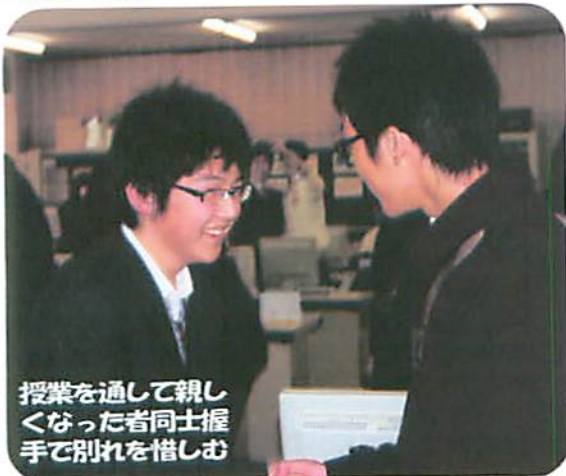
授業を通して親しく なった者同士握手で別れを惜しむ

台湾の国立中れき高等商業職業高校との交流がありました。 修学旅行で来日した同校の三十五名（内三名は教員）は、十二月九日を本校で過ごしました。 交流会では声楽部と桜陵太鼓部が歓迎の演技を披露すると台湾の生徒も踊りや歌を披露してくれました。 また、授業では商業科のパソコンを使った学校の体験授業をおこないました。商業科の授業は日ごろ学習しているプレゼンテーションの技術や