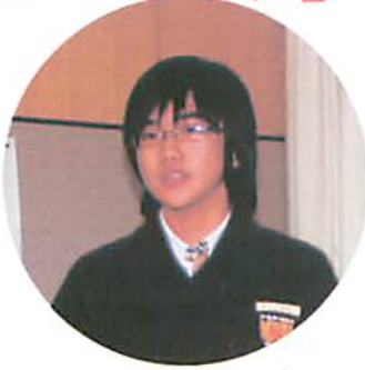
中れき高校の生 徒を代表して挨拶