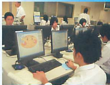
イラストレーターを利用した コンピュータデザイン。