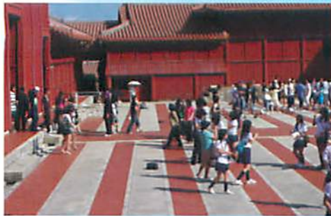
首里城は戦後復旧