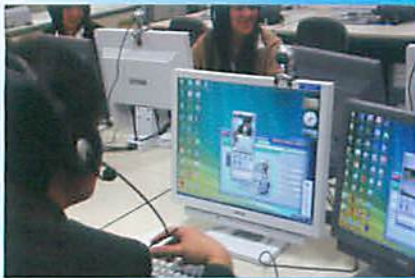
ネットワークを利用して 他校との模擬取引。