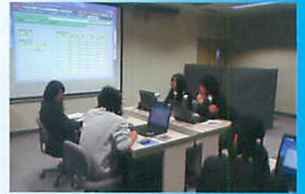
コンピュータは道具です。 使いこなして価値が出る。