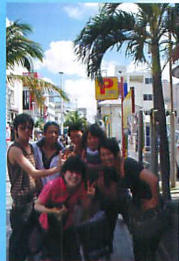
国際通りでショッピング

まだ夏本番のような沖縄で、マリンスポーツや沖縄の文化に触れて、充実したいい思い出がたくさんできました。