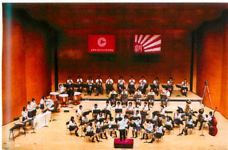
金賞 第44回長野県吹奏楽コンクール 上伊那・諏訪地区6校合同チーム