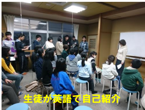
生徒が英語で自己紹介

昨年につき、公設学習塾ポブラアカデミーでは、地域貢献・地域交流を目的として、地域住民対象の「英会話教室」を開催しました。2月5日開講式が行われ、小学生も含め15名の立科町の方々が参加されました。塾生である本校生徒も講師のアシスタントとして参加し、教えることで自分も成長できると話しています。