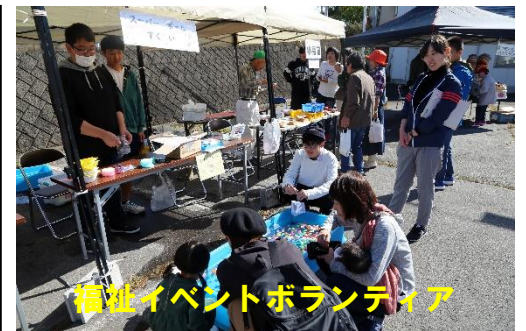
福祉イベントボランティア

「地域Ⅰ」では、地域住民との花壇づくりや女神湖カヌー体験など、地域の魅力発見や地域貢献の意識を育てています。 「夢高タイム」では、職場見学・学校見学のほか、りんご園での農業体験やマラソン大会・福祉イベントでのボランティア活動など、将来の職業選択に向けて考える機会にするとともに、地域貢献を行い、地元からも大きな評価を頂いています。