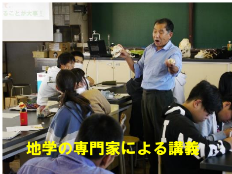
地学の専門家による講義