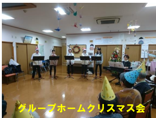
グループホームクリスマス会

昨年12月23日、合唱同好会が、立科町内グループホームのクリスマス会に出演しました。クリスマスソングなどを披露し、一緒に手をたたいたり歌ったり、皆さん笑顔で楽しい時間を過ごされました。2月3日には、今年で10回目となる「立科町合唱祭」にも出演しました。いずれも夢科高校の代表として地域に貢献し、地域を盛り上げる素晴らしい活動です。