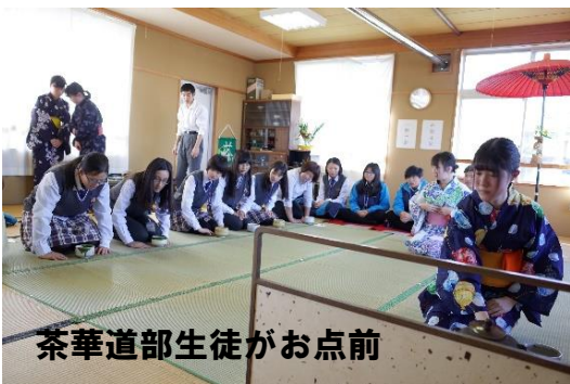
茶華道部生徒がお点前