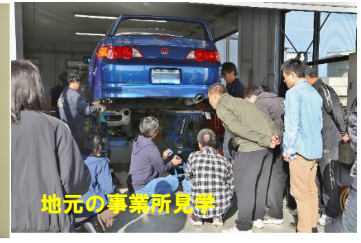
地元の事業所見学