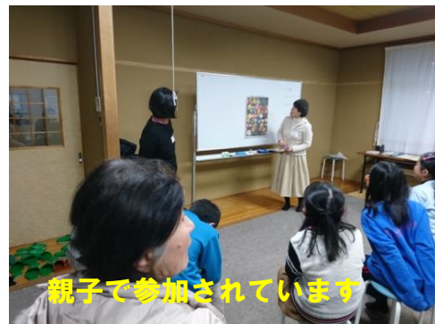
親子で参加されています