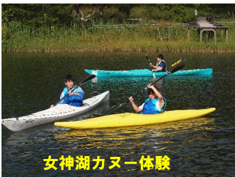
女神湖カヌー体験

「地域Ⅰ」では、地域住民との花壇づくりや女神湖カヌー体験など、地域の魅力発見や地域貢献の意識を育てています。 「夢高タイム」では、職場見学・学校見学のほか、りんご園での農業体験やマラソン大会・福祉イベントでのボランティア活動など、将来の職業選択に向けて考える機会にするとともに、地域貢献を行い、地元からも大きな評価を頂いています。