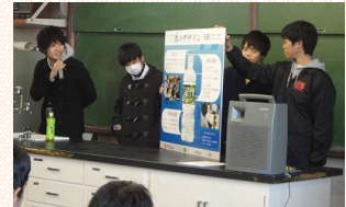
「地域デザイン」発表会(地域Ⅱ)