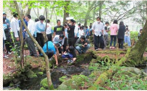
塩澤堰の見学(蓼科学)

「地域と共に知恵と勇気を育む」という本校の教育理念に根ざした授業です。「地域Ⅰ・Ⅱ」では、地域の環境・風土に関連する様々な体験学習を通じて、「蓼科学」では、地域の歴史や文化に関連する学習を通じて、ひとりひとりが自分と地域との関係性を考え、関わり方や生き方をデザインしていきます。