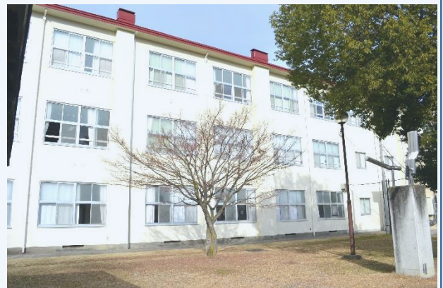
教室棟もきれいになりました。