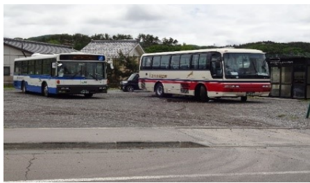
5月、分散登校・JRバス・学校バス