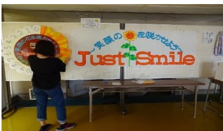
7/13 昇降口に ポプラ祭 テーマJust Smile