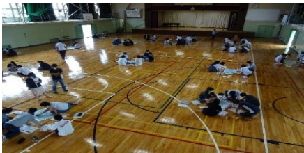
7/1 仕事・資格グループワーク:1年