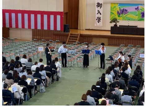
入学式前に行われた室内楽部の演奏