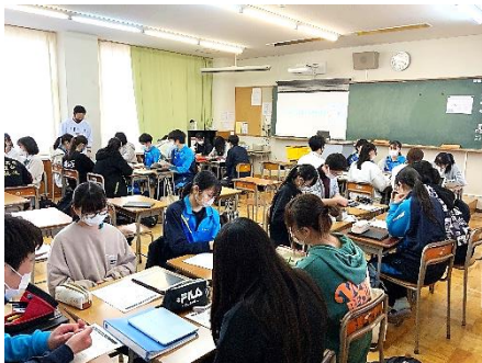
クラスを超えた探究活動の様子

4月は探究のチーム編成や論題の作成から始まり、第1回のディベート大会に向け、チーム毎リサーチやディベートの練習を行っていました。昨年度の探究発表会においても、日常生活に潜んでいる課題や疑問に端を発し、優れた探究成果を見せてくれました。今年度も自らの探究心を最大限に発揮し、興味深く、優れた学習が行われることを期待しています。