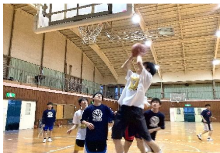
5月の総体に向けて練習する様子

今年度は新型コロナウイルスの影響で、学級閉鎖や学年閉鎖、臨時休業が相次ぎ、当初予定していた日程より一週間遅れてクラブ結成式が行われました。コロナ禍で新入生の勧誘を制限されるなか、様々な工夫をして1年生を迎えていました。1年生からは、「中学の部活の先輩が成長している姿を見て、僕もこうなりたいと思った」「先輩方の練習している様子や発表を見て、この部活に入りたいと思った」という声が聞こえてきました。1年生が加入し、運動部は5月の総体予選に向けて、文化部は6月17日（金）から始まるりんどう祭（文化祭）に向けて、新体制をスタートしました。各部活動の今後の活躍が期待されます。