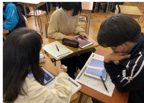
iPadを使った調べ学習の様子