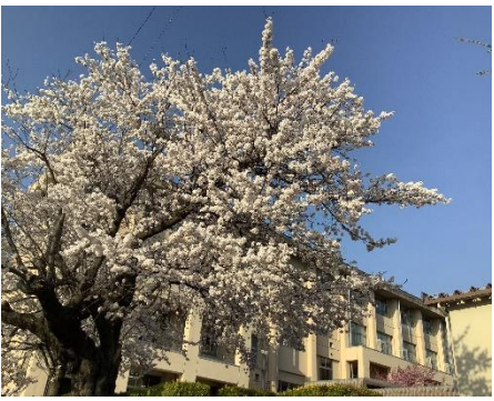
今年度も本校には桜が咲き誇り、新入生を出迎えてくれました