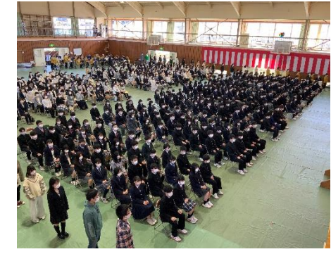
校歌披露の様子です 感染対策のため、新入生と生徒会役員が向き合わない形で行われました