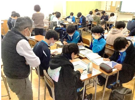
テーマ毎に分かれた探究活動