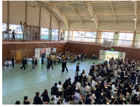
吹奏楽部の演奏の中で新入生入場

須坂高校では、今年度から単位制が導入されました。これに伴い、2年次以降生徒自らが学びたい授業を受講することが可能になりました。須坂高校が目指す姿である「 大学のないまちの大学のような高校 SAH (Super Academic High school) 」を、新入生とともに盛り上げていきたいと考えています。