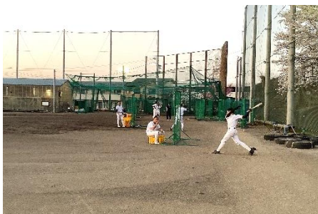
新型コロナによる影響の中、各部工夫しながら懸命に練習しています