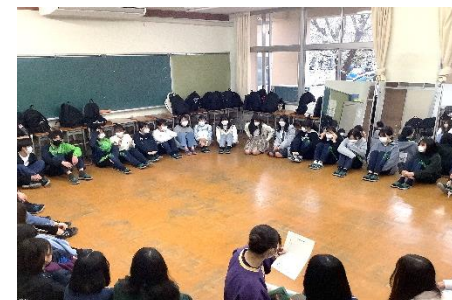
クラブ結成式の様子 たくさんの部員が入りました