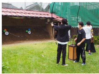
弓道部による体験 行列ができていました