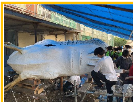
② 龍の頭部を仕上げに、色つけを行っている様子