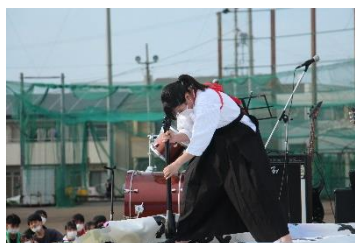
前夜祭での 書道パフォーマンス