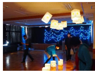
▲校内企画による展示 (光のページェント展)