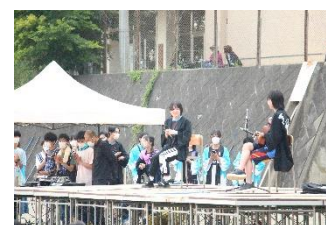
▲後夜祭での弾き語り ▼ダンス部の発表 ▼閉祭宣言をする祭長