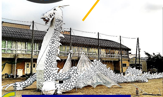
今年の龍には翼ができました！