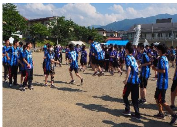
全校生徒の協力のもと、祭執行が中心となり、 素晴らしい第68回りんどう祭を行うことができました