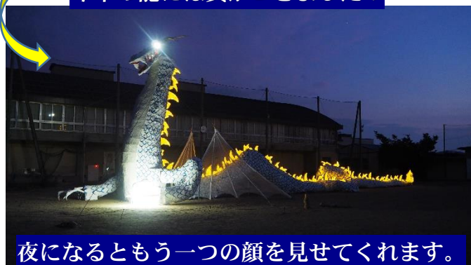
夜になるともう一つの顔を見せてくれます。

毎年進化していく須坂高校の龍。 来年の100年龍は、果たしてどんな姿を現してくれるのか楽しみです！