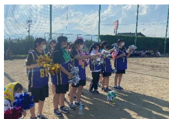
今年の体育祭は1～3 学年の同じクラスで対 抗戦が行われました