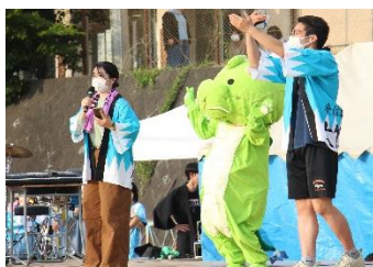
須坂高校のマスコット りゅうたん

6月16日(木)～6月19日(日)にかけて、第68回りんどう祭が開催されました。今年は三年ぶりとなる一般公開を行い、約2,800人もの方々に来校していただきました。多くの方にお越し頂いたことで、改めて須坂高校のりんどう祭が愛されていると実感しました。残念ながら当日来校できなかった方々は、りんどう祭の様子を本校公式ホームページや須坂高校たよりで載せていますのでご覧ください。