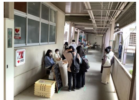
地元のお店とタイアップした商品や古民家プロジェクトの商品を販売する様子