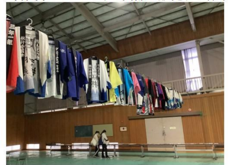
歴代の法被が展示されていました