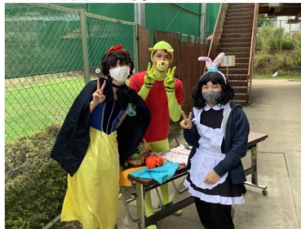
仮装をした人にはお菓子のプレゼントがありました