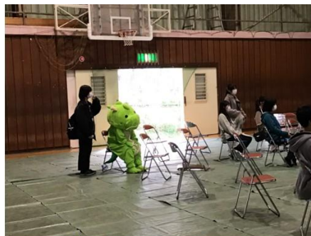
須坂高校マスコットキャラのりゅうたんも参加していました