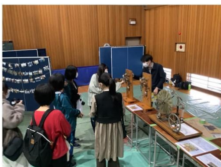
須坂高校に残されていた貴重な実験道具で生徒が体験している様子