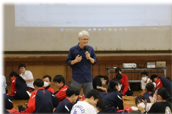
1年生の「哲学対話」の様子です↑