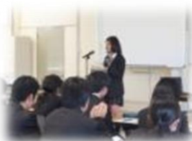
産社：家族レポート発表