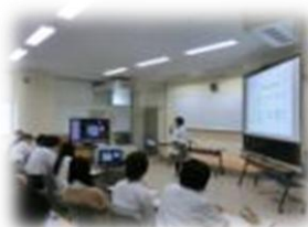
産社：2分間スピーチ発表