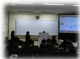
産社：職業調べ発表