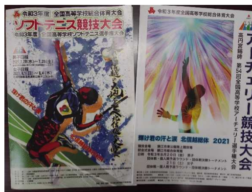
高校総体出場部門のパンフレット ソフトテニス(左)石川県開催、アーチェリー(右) 福井県開催