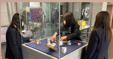
文化ビジネス(地域の文化・産業の理解)

地域をフィールドにした活動により実践力を身につけます 商業・服飾の学びから専門的知識・技能を身につけます