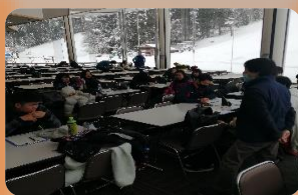
デュアルシステム(職業理解)