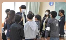
諏実タウン(商品開発・小学生とコラボ)