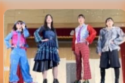
ファッションショー