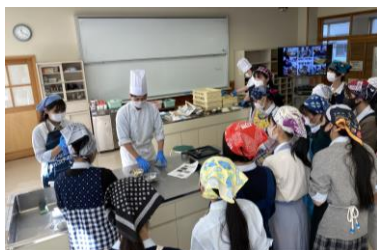
信州未来のひとづくり塾