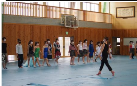
ウォーキング講習