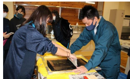
Tシャツプリント体験