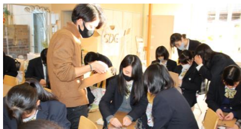
岡学園見学・ワークショップ