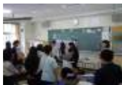
中学校での家庭科授業サポート