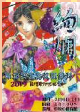
今年のポスターです