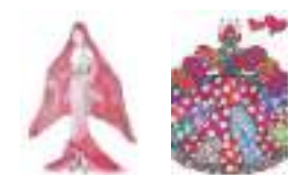
最優秀賞 / 新人賞