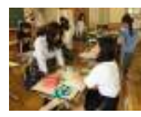
小学生対象 デザイン講座「ともそだち教室」