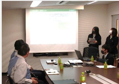
マイクロ発條(株) 様