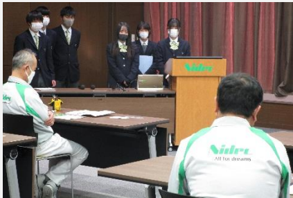
日本電産サンキョー(株) 様

約10社に出向き、Jリーグサッカーチーム「松本山雅」の協賛企業を募るプレゼンを行いました。