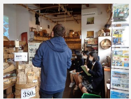
伝統産業「寒天」の製法学習

通常より2か月遅れての授業開始の中、校外学習に出る活動は8月以降から本格的にスタートしました。このような状況下でも地域の皆様に支えられ充実した学習をすることができました。