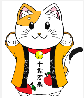
タウンキャラクター「じつにゃん」

今年は、文化祭も一般公開が中止。そこで、諏実タウンでは文化系クラブ発表会を企画予定です。過去の先輩たちも行っていなかった新しい形のタウン開催に向け手探りではありますが、確実に前に進んでおります。