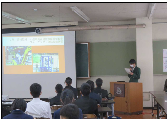
資格取得について説明