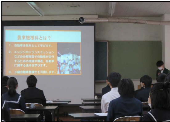
学科のオリエンテーション