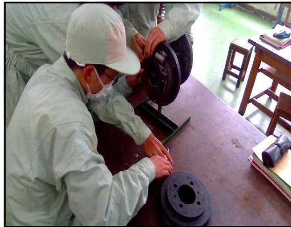
ブレーキの部品の確認