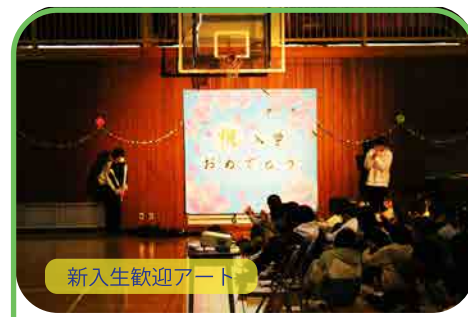
新入生歓迎アート