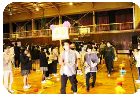
コロナ禍により生徒会役員・文化祭実行委員と新入生のみ参加