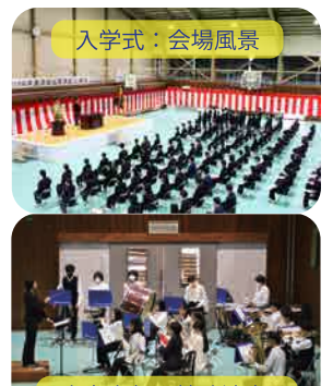
吹奏楽部：校歌演奏