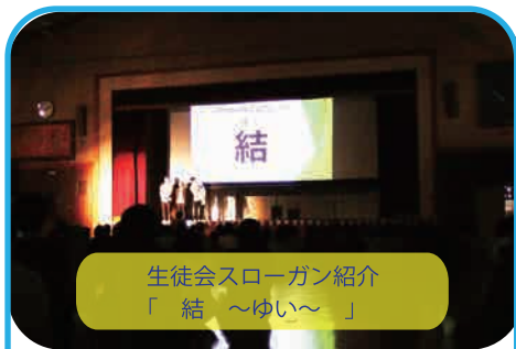
生徒会スローガン紹介 「結 ～ゆい～」