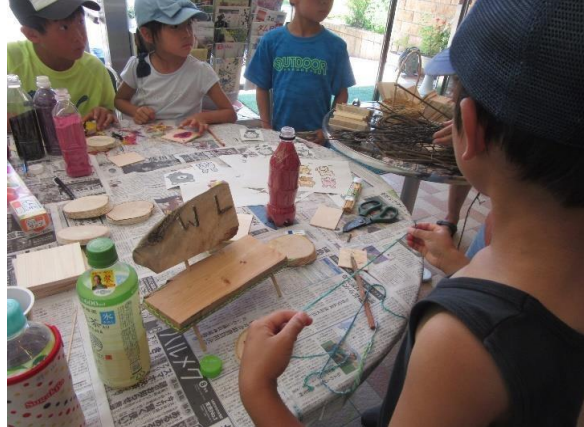
流木での工作体験