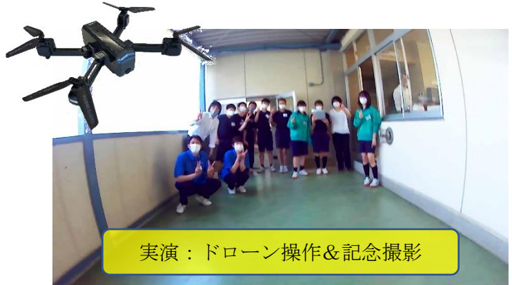
実演：ドローン操作&記念撮影