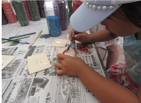
着色木粉でのお絵かき体験