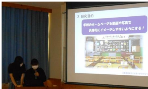
◀学校PR動画 学校環境整備事業と▶ 木曾福島GSカップ賞状作成