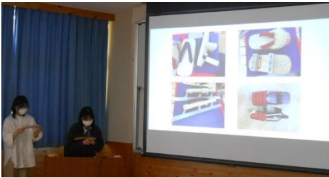
◀ネズコ下駄の研究 木のおもちゃの研究▶

本年度の取組では、「ネズコ下駄の研究」「こども園交流」「学校PR動画」「木のおもちゃの研究」「学校環境整備事業」「アームバックデザイン」「上松町PRパンフレット」等のテーマが上がり発表がこなわれました。年度末まとめの発表会は、令和5年1月25日（水）に実施いたします。