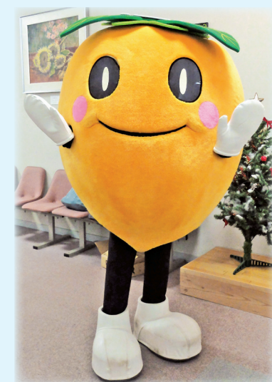
犀峡校マスコットキャラクター「さいきょん」

特色ある授業、地域をフィールドにした授業 生徒会も部活動も即戦力 ここでしか体験できない高校生活を経験しませんか？