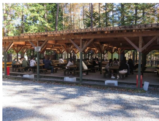
リアル宝探しゲーム