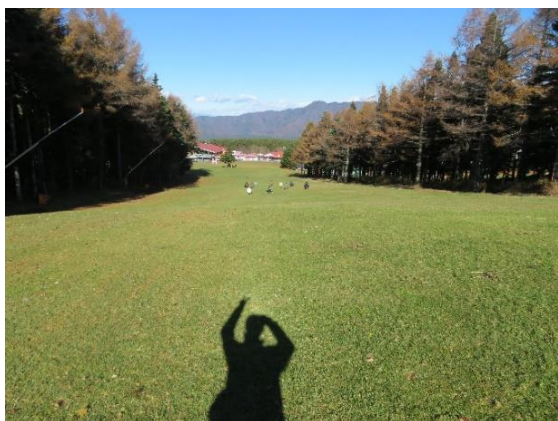
ふじてんリゾート

旅行先は沖縄ではありませんでしたが、ケガなくみんなで楽しんで充実した修学旅行になりました。