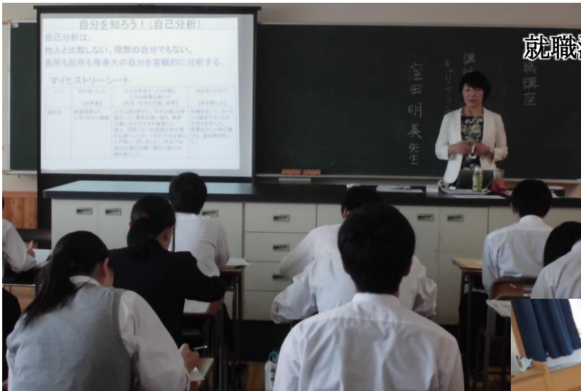
就職活動の心構えや自己PRの講義

3 年生進路学習の 20 日 (火)、自分の進路について深く考え、その実現に向けていっそう前向きに取り組めるよう様々な進路学習会が行われました。大学進学希望者は、人文、政治経済・法学、教員養成、理学・工学、農学・食品・家政、看護・医療、芸術・体育など 7 つの分科会に分かれたワークショップや志望理由書の講義、大学・短大等の進路相談ブースでの相談会を行いました。公務員・就職希望者は、求人票の見方から始まり専門家による分野別の講義、公務員模試の受け方、受験計画、マインドマップ作成、志望理由書に挑戦するなど、いよいよ始まる就職活動へ向けて具体的な課題をあらたにしました。