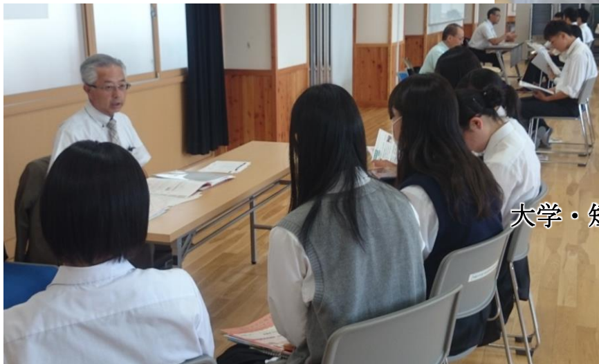
大学・短大・専門学校の進路相談ブース