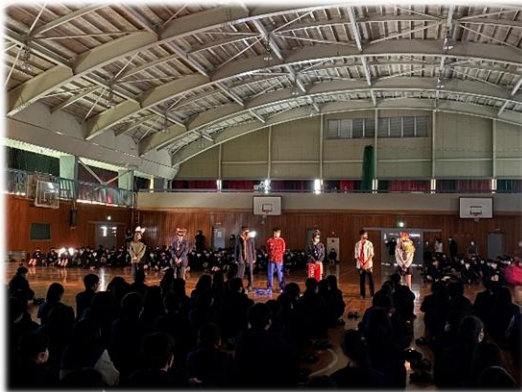
制服きこなしガイダンス