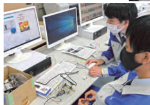
機械・電子・電気系学科 建設系学科 商業系学科