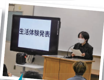
生活体験発表大会