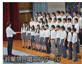
鈴蘭祭合唱コンクール