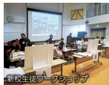
新校生徒ワークショップ