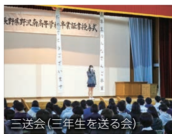
三送会(三年生を送る会)