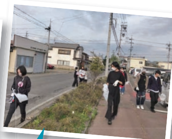
全定合同地域清掃