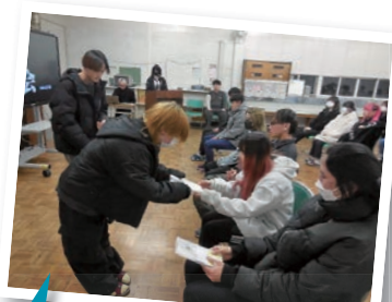
予餞会（4年生を送る会）