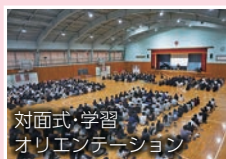
対面式・学習オリエンテーション

新入生が上級生に迎え入れられ、校歌を歌い、生徒会から行事の説明やクラブの紹介もあり、本高生としての歩みが始まります。