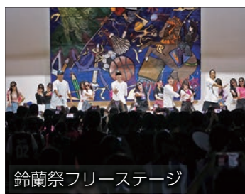
鈴蘭祭フリーステージ