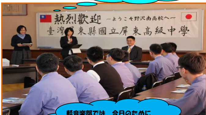
軽音楽部では 今日のために オーディションを実施!