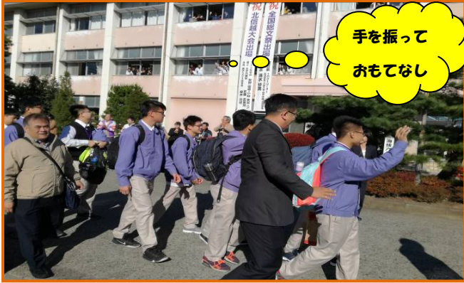
手を振って おもてなし

11月6日(月)、台湾最南端の屏東県にある国立高級中学から、22名の皆さんが来校されました。