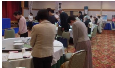
黙禱を捧げる会員

～楽しく身体を動かそう～と題したご講演をいただきました。サブタイトルのおり、それは楽しい時間が共有できました。