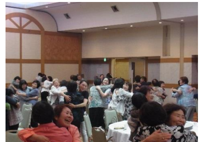
講演実技の一齣 ハグ? イヤ-テレナー