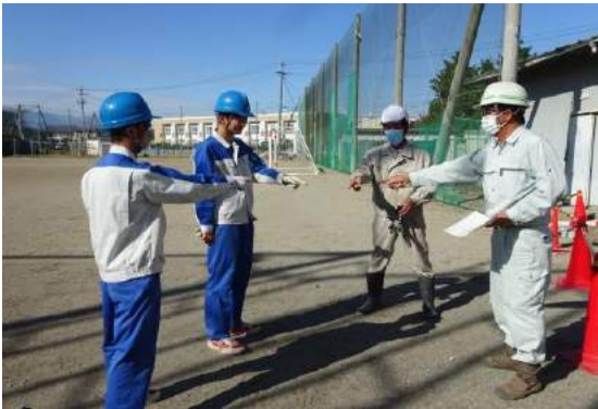
作業工程の確認と安全確認