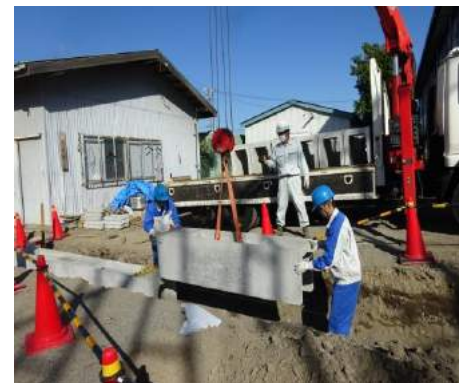
自由勾配 U 字溝設置