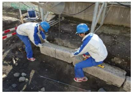
御影石での側溝壁設置