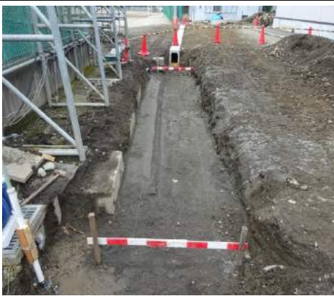
水路上流集水側溝基礎丁張り