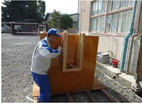
沈砂槽型枠づくり