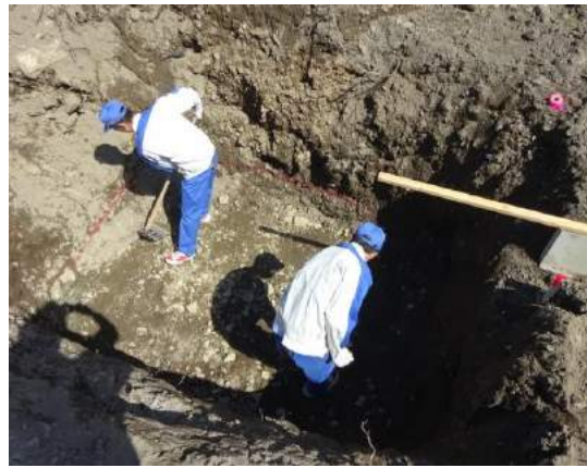
沈砂槽の掘削地ならし