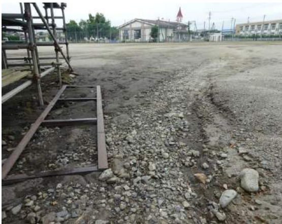
豪雨で流失した土砂