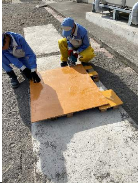
コンクリート平板の型枠づくり