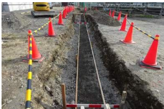
水路上流工事前自由勾配 U 字溝捨てコン準備