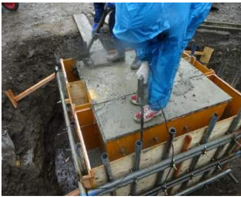
コンクリート打設、バイブレータかけ