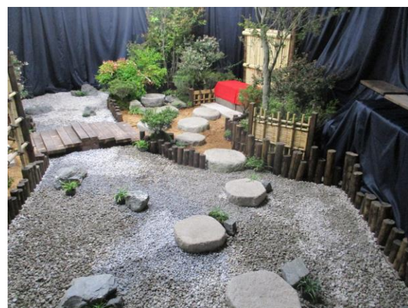
出口から見た風景