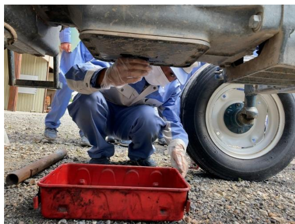
エンジンオイル交換から始めます