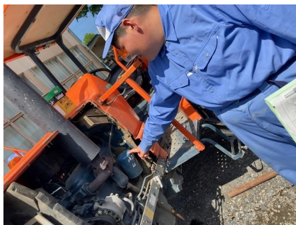
エンジンオイルエレメントも交換します