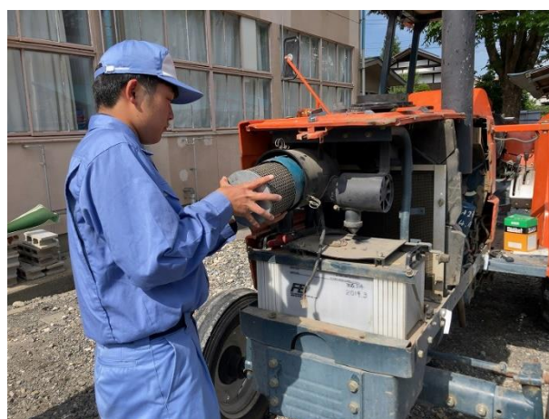
簡単なメンテナンスを行いました