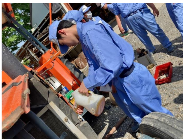
新しいオイルを入れます