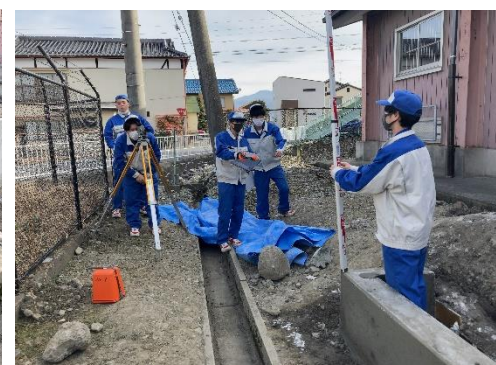
図面通りにできているか 測量して確認します