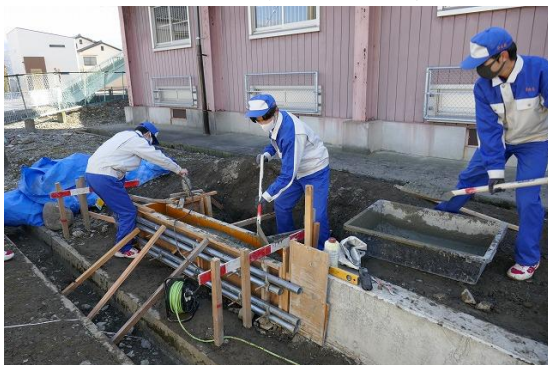
コンクリートを打設し