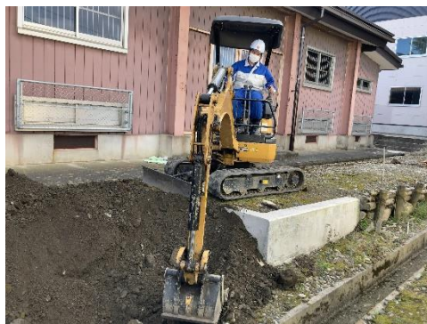
施工現場を掘ります