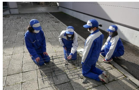
コンクリートに入れる鉄筋を作成中