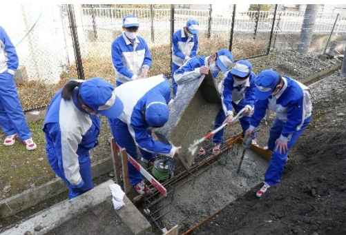
掘った場所に型枠を設置し、 コンクリートを入れています