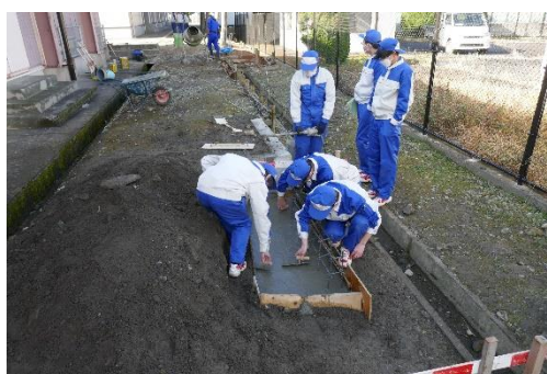
基礎部分が完成しました