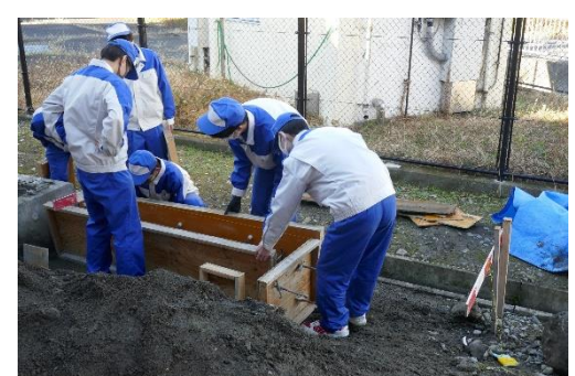
型枠を設置しています