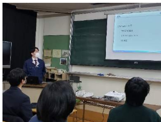
生徒へ企業説明会を実施