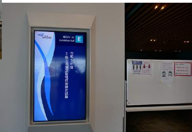
受験会場は名古屋市ポートメッセ名古屋でした (10月24日)