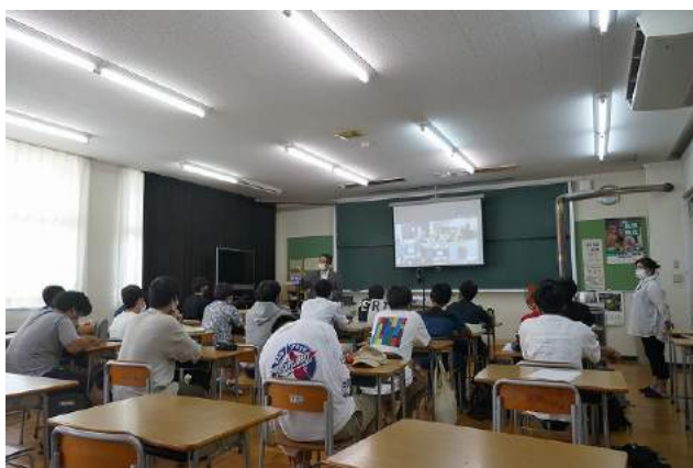
夏休み中の夏季補習 (8月4日)

受験に関しては、講習会や生徒の受験会場までの移動等に対して長野県建設業協会にご協力頂きました。