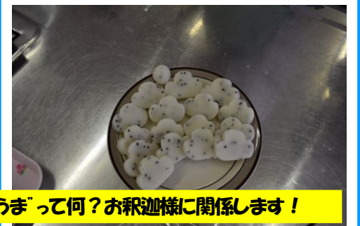
ところで「やしょうま」って何？お釈迦様に関係します！