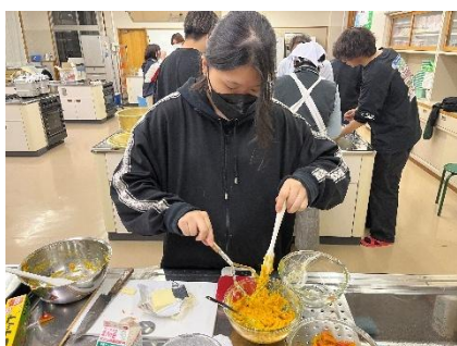
▲カボチャを細かくしてこねる