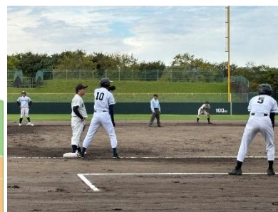
▲タイムリーヒットで出塁