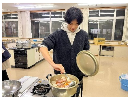
▲大きい鍋での芋煮づくり