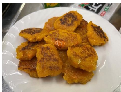
▲食べるととても甘みがある