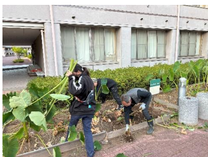
▲背丈ほどの茎を刈り収穫

5月に苗を植えてから半年間育ててきた里芋善光寺を10月24日(金)に収穫し、水を使って里芋の土落としを行いました。毎年この時期は日が短くなり、気温も低く、厳しい作業ですが、それでも2年生が先頭に立って生徒たちは一生懸命たくさん実がついた里芋を掘り、冷たい水で土を洗い流し、そこから11月の収穫祭の芋煮で使用するまで保管しておきました。