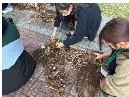
▲たくさんの里芋を1つ1つ分ける