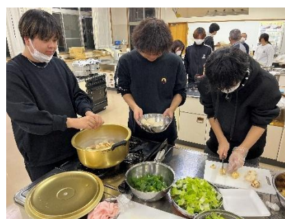
▲男子も一生懸命調理