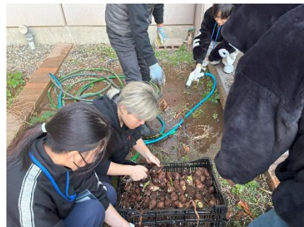
▲水で外側の土を洗い流す

11月7日(金)は収穫祭の芋煮づくりが行われました。10月に収穫してあった里芋を1つ1つ丁寧に皮むきをして下準備を行ってから、調理室へ移動し、本格的な芋煮とマッシュパンプキンづくりを行いました。芋煮は醤油味と味噌味の2種類を作り、カボチャをつぶしてバターで焼きました。普段なかなか調理をする機会がない生徒たちもみんなで協力し合いながら、作っている姿は本校の人間関係の良さを映し出している光景だと思いました。「美味しい芋煮を食べたい。食べさせてあげたい。」というみんなの思いが通じたのか、大鍋3つで作った芋煮もきれいに無くなるほど大盛況でした。