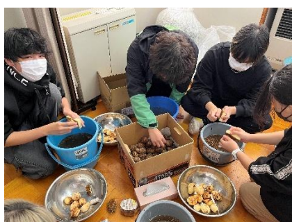
▲ブラシで皮をむく

11月7日(金)は収穫祭の芋煮づくりが行われました。10月に収穫してあった里芋を1つ1つ丁寧に皮むきをして下準備を行ってから、調理室へ移動し、本格的な芋煮とマッシュパンプキンづくりを行いました。芋煮は醤油味と味噌味の2種類を作り、カボチャをつぶしてバターで焼きました。普段なかなか調理をする機会がない生徒たちもみんなで協力し合いながら、作っている姿は本校の人間関係の良さを映し出している光景だと思いました。「美味しい芋煮を食べたい。食べさせてあげたい。」というみんなの思いが通じたのか、大鍋3つで作った芋煮もきれいに無くなるほど大盛況でした。