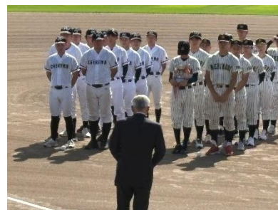
▲チームの一員として開会式参加