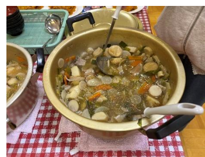
▲具だくさんの芋煮