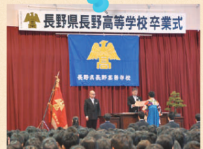
卒業式 3月上旬、凛とした雰田気の中で全日制・定時制合同の卒業式が行われ、長高生は世界に巣立ちます。