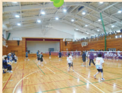
クラスマッチ 春・秋の年2回、クラス対抗で5種目が行われます。教員チームも参加し、熱戦を繰り広げます。