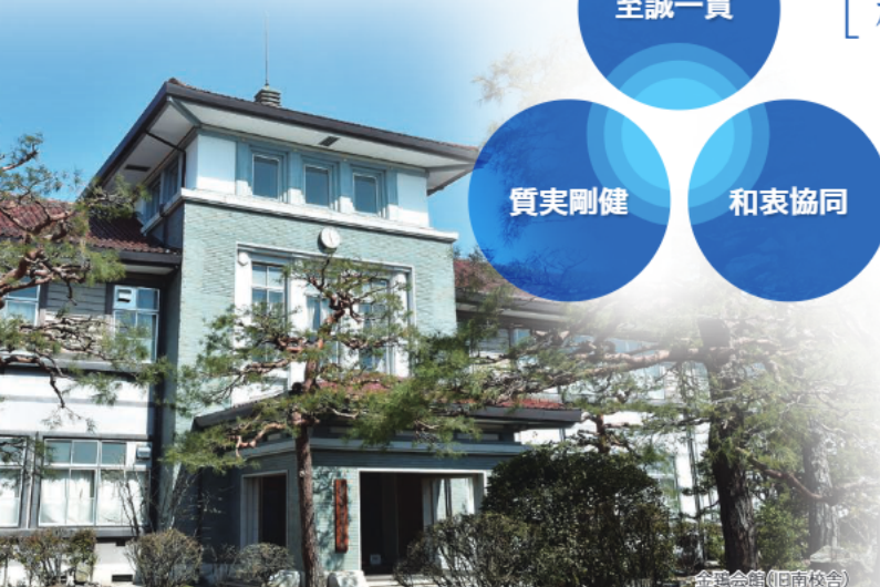
金鷺会館(旧南校舎)