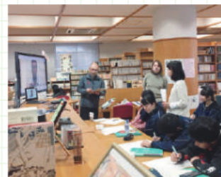
APU外国人留学生とオンラインで