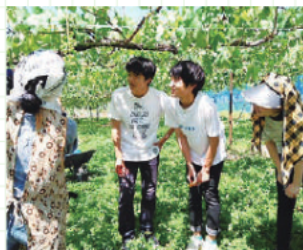
フィールドワークで地域から学ぶ