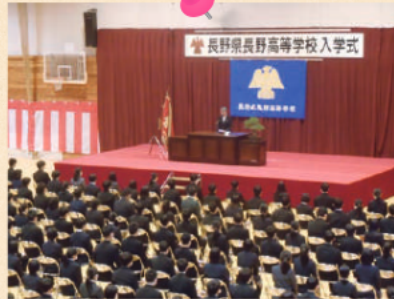
入学式 一人一人の氏名が呼ばれ、学校長により入学が許可されました。いよいよ、長高生としての生活が始まります。