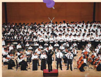
音楽会 1・2年の合唱コンクールのほか音楽選択者全員が登壇する「第九」が圧巻です。