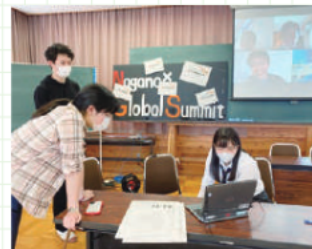
国際会議を開催し、協働で提言する