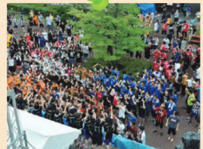
金鶏祭 3日間の日程で全体行事・文化班の発表・クラス発表など盛りだくさんの内容で行われます。