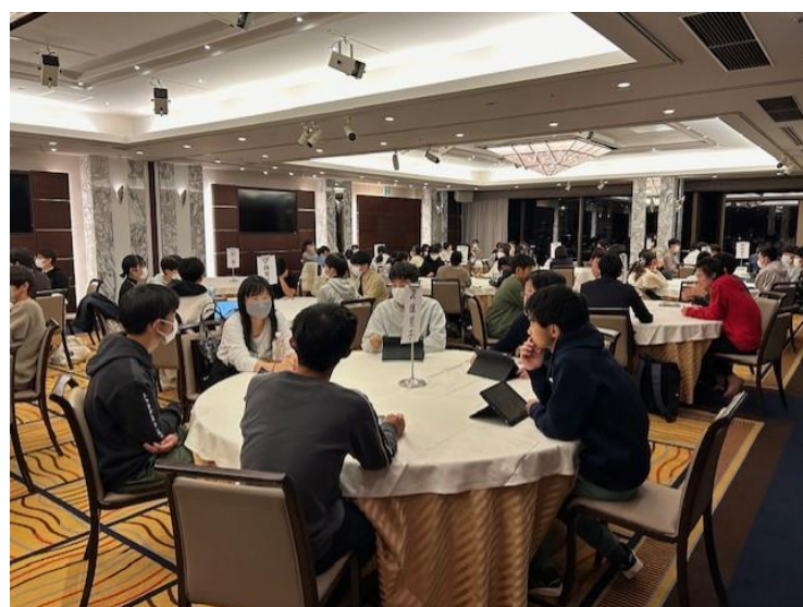
キャンパスツアーOB・OG交流会

29名のOB・OGが参加して交流会を開いてくれました。東北を訪れたコースもありました。11時40分ころ筑波大学着。3コースにわかれ先輩たちの案内でキャンパス見学。その後仙台へ移動し、東北大のOB・OGが9人集まってくださり交流会を持ちました。2日目は文系と理系に分かれて模擬授業をうけたり、研究室を訪問したりしました。とても丁寧かつ熱心に時間をかけていただいたと聞いています。OB・OGの皆さんの中にはこの交流会に出席して本校1年生から受けた刺激を糧に、今後の就職活動も頑張りたいとの感想を述べた方がいたそうです。