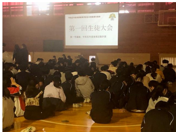
31日（火）生徒大会の様子

https://tobitate-mext.jasso.go.jp/nextstage/