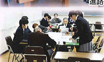
地域の皆様と懇談会