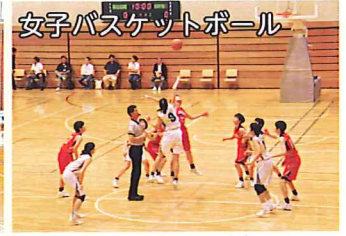
女子バスケットボール