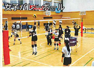
女子バレーボール