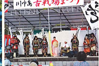
川中島古戦場祭り