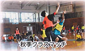
秋季クラスマッチ