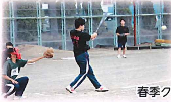
春季クラスマッチ