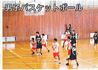
男子バスケットボール