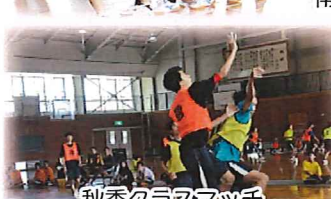
秋季クラスマッチ