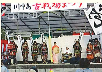
川中島古戦場祭り