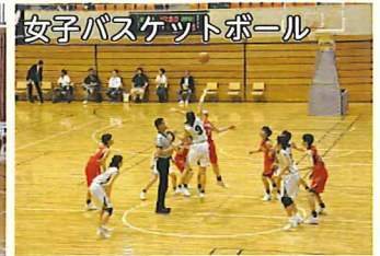
女子バスケットボール