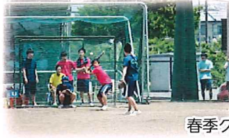
春季クラスマッチ