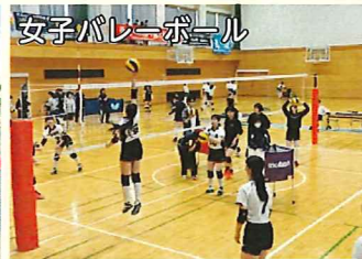
女子バレーボール