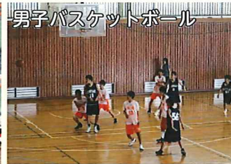
男子バスケットボール