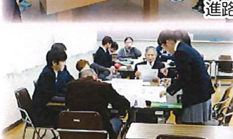
地域の皆様と懇談会